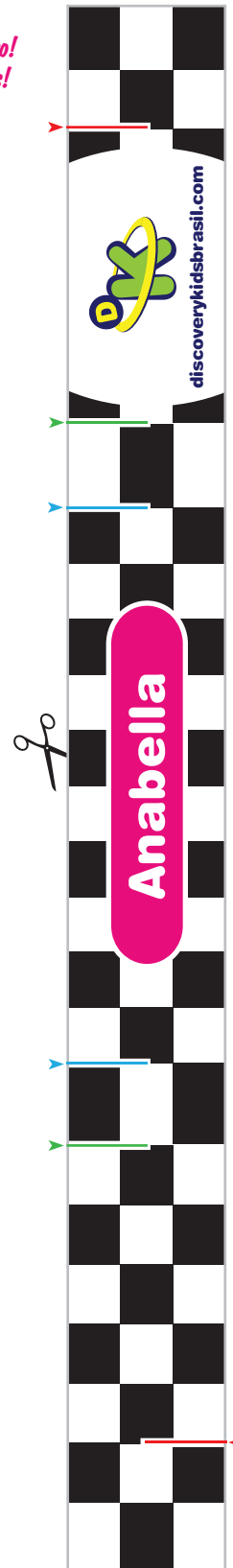
Rollo para la base