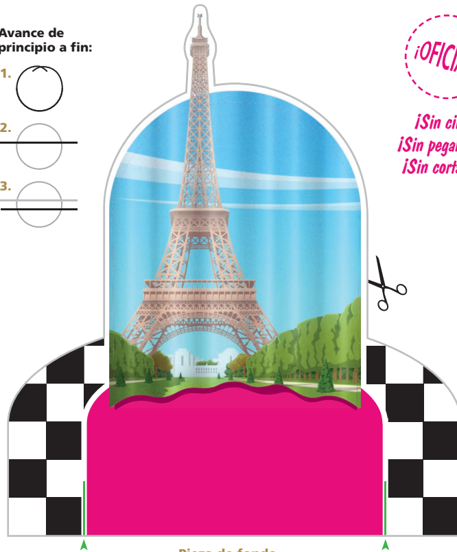
Pieza de fondo

¡Sin cinta! ¡Sin pegamento! ¡Sin cortantes!