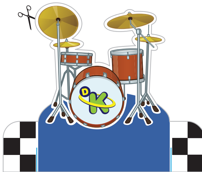
Pieza del frente

Fico es el payaso del grupo. Siempre está contento y se destaca por ser divertido, cariñoso e impulsivo. Es un auténtico torbellino, impetuoso y enérgico, hasta el punto de rozar la hiperactividad. Se confunde y distrae con facilidad y esta situación habitualmente lo conduce a vivir situaciones torpes y difíciles que lo ponen en apuros. Adora las actividades arriesgadas, los deportes acuáticos y la velocidad.