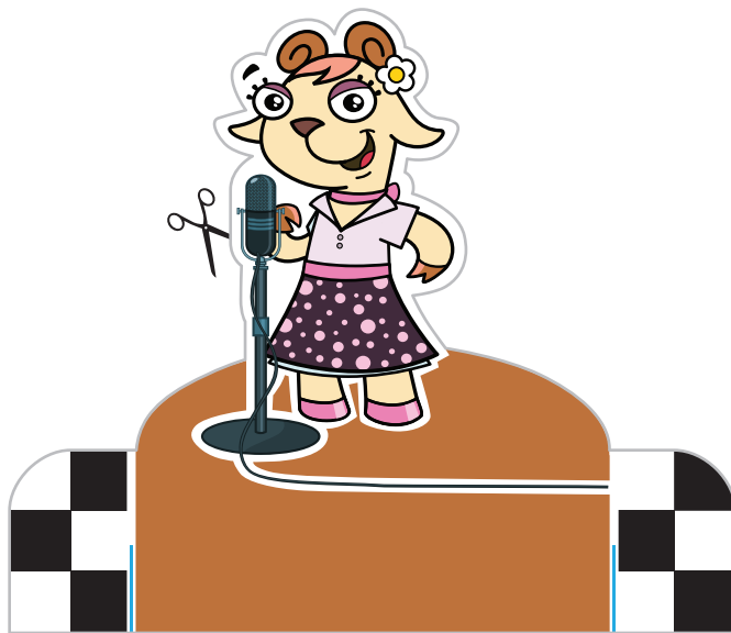
Pieza del frente

Gabi es brillante, enérgica y precoz. Siempre con actitud adulta, suele usar palabras complejas que no necesariamente entiende. Tiene un gran sentido del humor y es valiente, leal, obstinada cuando es necesario y muy competitiva. A pesar de su evidente madurez, oculta un punto débil: tiende a creer que es la mejor informada del grupo, mostrándose insensible ante los sentimientos de los demás. Su gran corazón la salva de todas las situaciones complicadas.