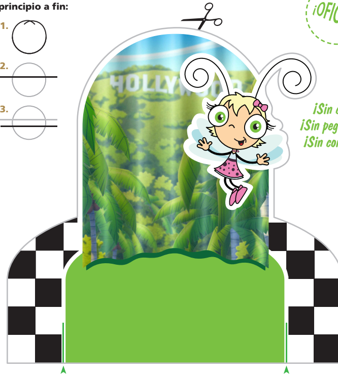
Pieza de fondo

¡Sin cinta! ¡Sin pegamento! ¡Sin cortantes!