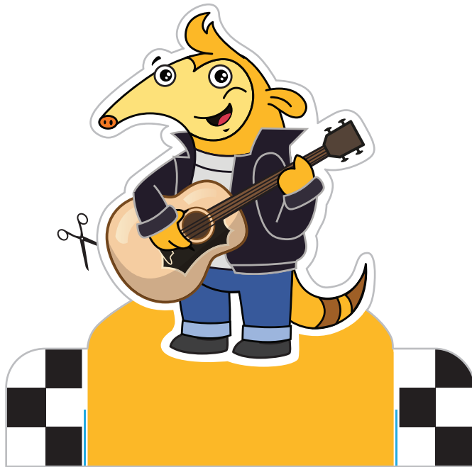
Pieza del frente

Oto es el capitán, conductor o piloto de cualquier vehículo o método de transporte que el grupo de exploradores usa en sus aventuras. Su confianza en sí mismo no siempre encaja con sus habilidades y sus "aterrizajes perfectos". A Oto le encanta cambiar de ropa, disfraz o sombrero y siempre viaja con su amiga Mundi. Los dos forman el equipo más calificado del grupo. Lo que Oto rompe o estropea, Mundi siempre es capaz de arreglarlo.